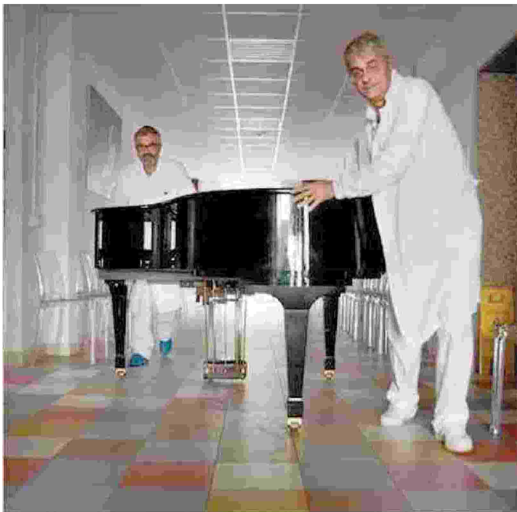
Un'immagine simbolica dei «Donatori di musica»